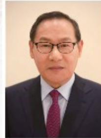
연출 | 김홍수